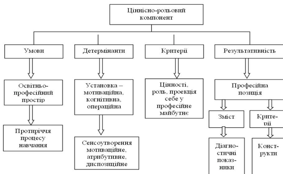
Рис. 2 Структурно-функціональна модель ціннісно-рольового компонента.

яльності, яка визначається ціннісним ставленням до професії, когніціями, установками, очікуваннями й примірюванням професійних ролей.