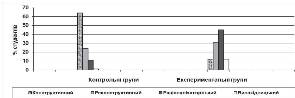
Рис. 2. Рівні сформованості професійної компетентності майбутніх інженерів.

внення, пошуку зв'язків і залежностей, обґрунтування правильності й оптимальності розв'язання.